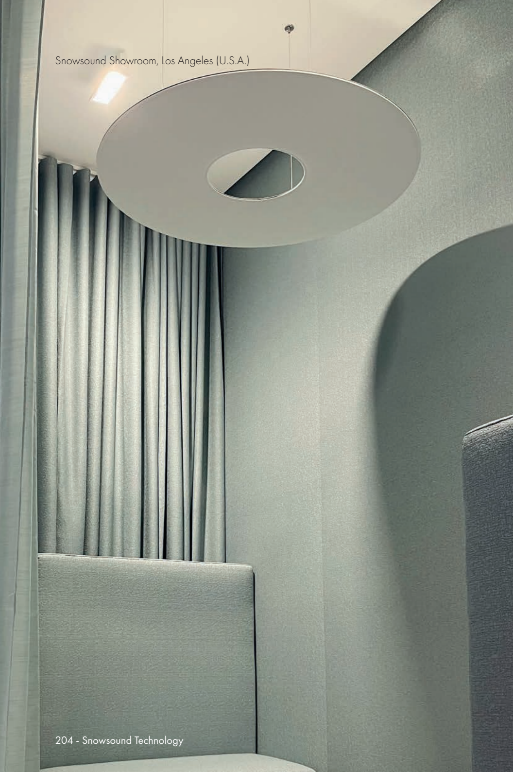
204 - Snowsound Technology