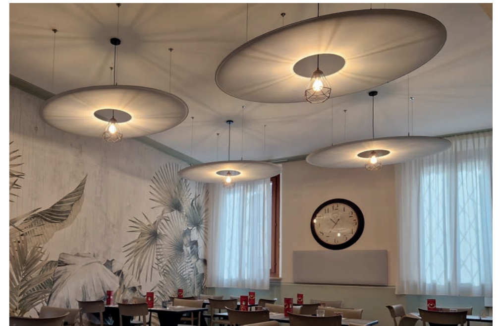
45° Parallelo - Sabbioneta MN (Italy)