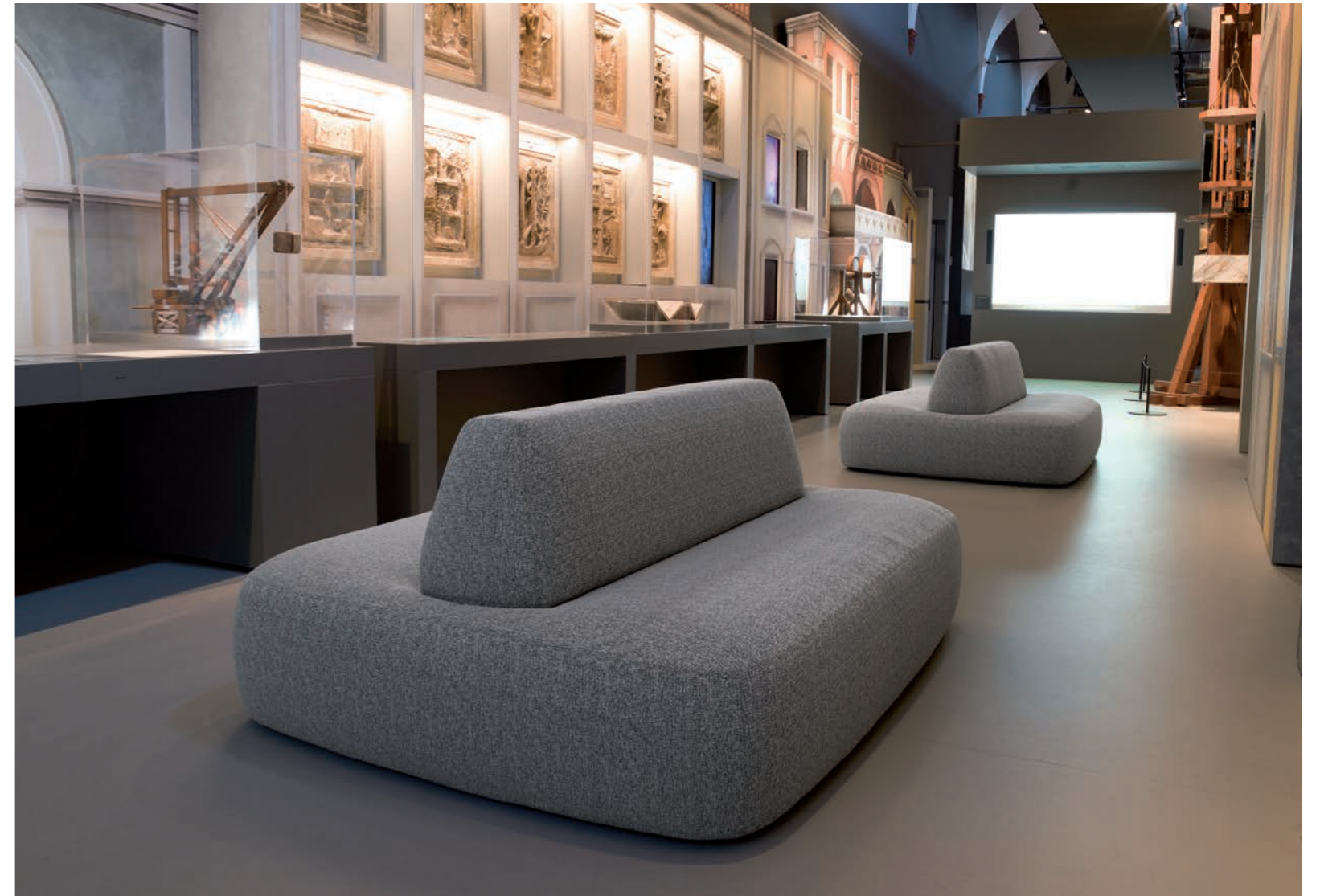
Gallerie Leonardo da Vinci, Museo Nazionale Scienza e Tecnologia, Milano (Italy)