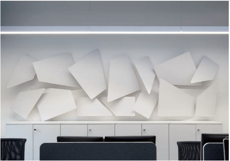
NGC Medical, Turate CO (Italy)