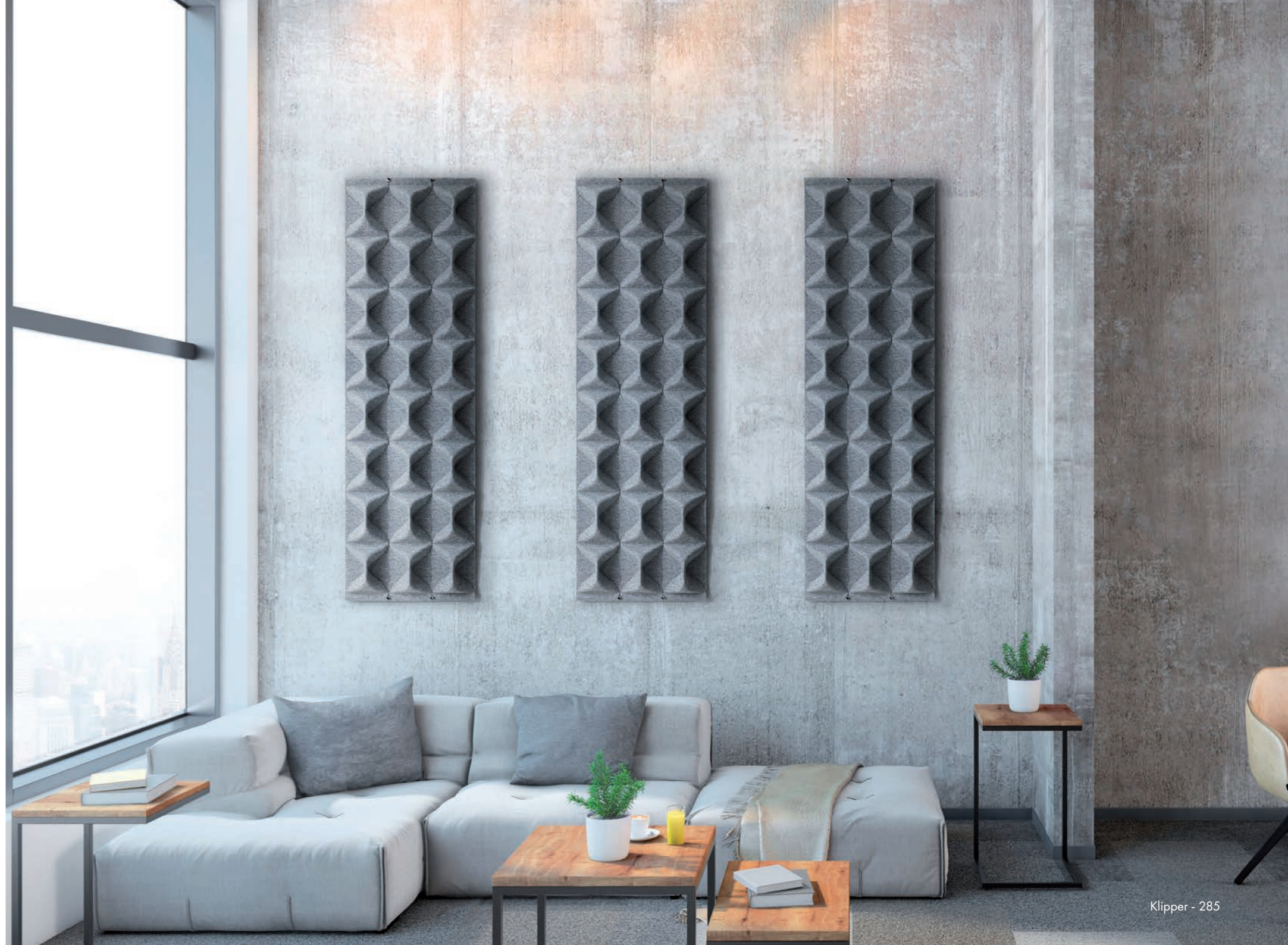
Klipper - 285