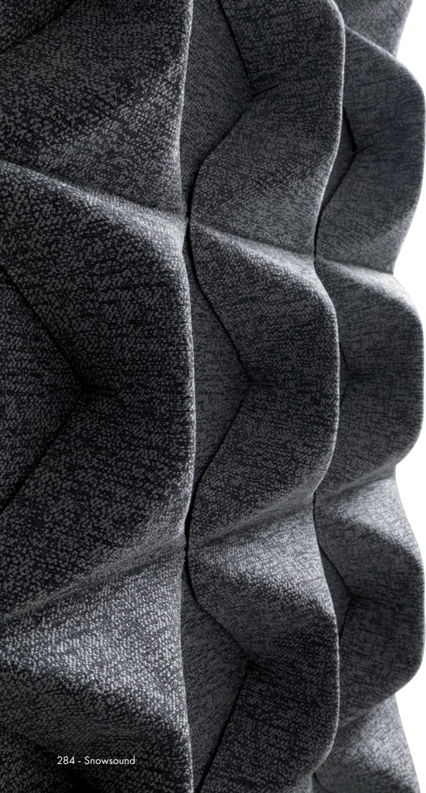
284 - Snowsound